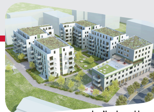
In „Neu Leopoldau – Junges Wohnen“ entstehen auf mehreren Bauplätzen ca. 350 SMART-Wohnungen.

Für diese beispielhafte 2-Zimmer-SMART-Wohnung (ca. 55 m 2 ) mit Balkon bestehend aus einer Wohnküche, Schlafzimmer, Bad, WC und Abstellraum betragen die monatlichen Kosten inkl. Betriebskosten und MwSt. € 412,50. Die Eigenmittel betragen einmalig rund € 3.300.